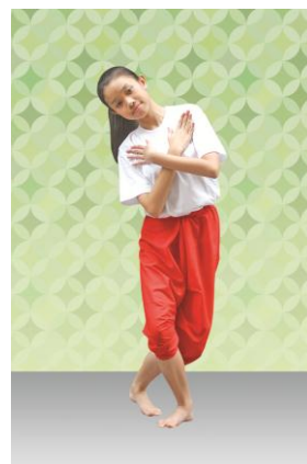
ท่าที่ 7 รักเจ้าสาว: มือทั้งสองประสานกันระดับอก เอียงขวา ก้าวหน้าเท้าขวา