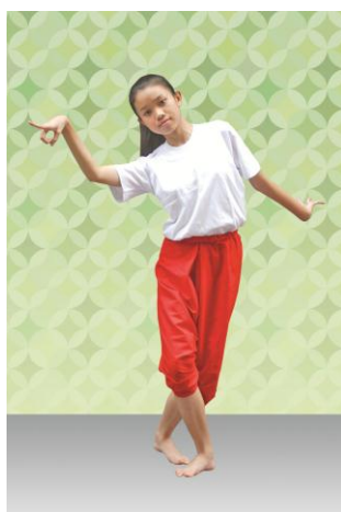
ท่าที่ 15 วันที: มือขวาชี้นิ้วไปด้านหน้าระดับสายตา มือซ้าย จับส่งหลัง เอียงขวา ก้าวหน้าเท้าขวา ค่อย ๆ หมุนรอบตัวช้า ๆ ตามทำนองเอือนมาด้านขวา