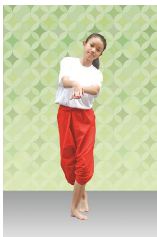
ท่าที่ 14 อยากให้ถึง: มือทั้งสองรวมมีระดับอก เอียงซ้าย ก้าวหน้าเท้าซ้าย