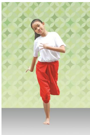
ท่าที่ 13 เฝาคำหนึ่ง: มือซ้ายจับหงายระดับอก มือขวาจับส่งหลัง เอียงขวา กระดกเท้าซ้าย