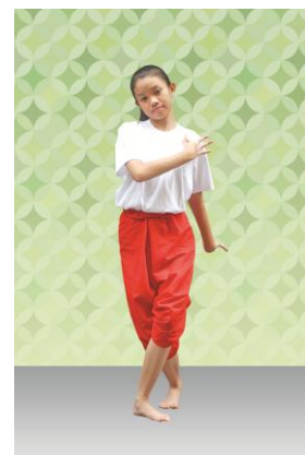
ท่าที่ 8 สีนวล: มือขวาจับหางที่ฐานไหล่ด้านซ้าย มือซ้ายจับส่งหลัง ลักคอซ้าย ก้าวหน้าเท้าซ้าย จากนั้นมือขวาค่อย ๆ ม้วนจับตามจังหวะเพลง พร้อมทั้งลักคอขวา-ซ้ายสลับกันตามจังหวะจนจบทำนองเอื้อน