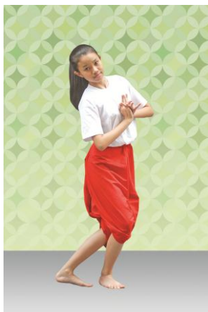
ท่าที่ 9 หวนคิดถึง: ฝ่ามือทั้งสองประสานกันระดับอก เมียงตัวมาด้านซ้าย เอียงขวา ก้าวหน้าเท้าขวา แล้วหมุนตัวมาด้านขวา