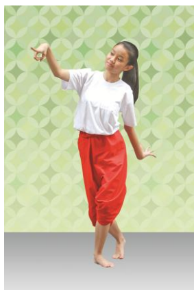
ท่าที่ 6 เมื่อยามเช้า: มือขวาชี้ขึ้นไว้ระดับคิ้วจับมือซ้ายส่งหลัง เอียงซ้าย ก้าวหน้าเท้าซ้าย